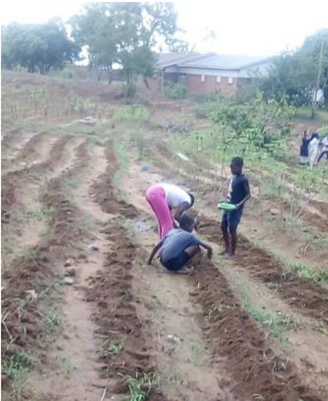
Pinda's, bonen en mais planten